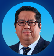
Alex Contreras Ministro de Economía y Finanzas